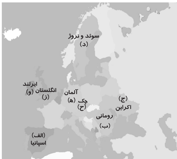
«نواحی صنعتی مهم در قاره اروپا»

۱۴۹- کدام شهرهای زیر از نظر میانگین بارش سالانه به طور یکسان عمل می کنند؟